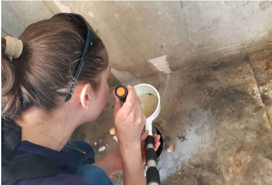
מנשרת יתושים בוחנת מים מניקוז בחדר אשפה, שאספה בעזרת מצקת, כדי לזהות זחלי יתושים.