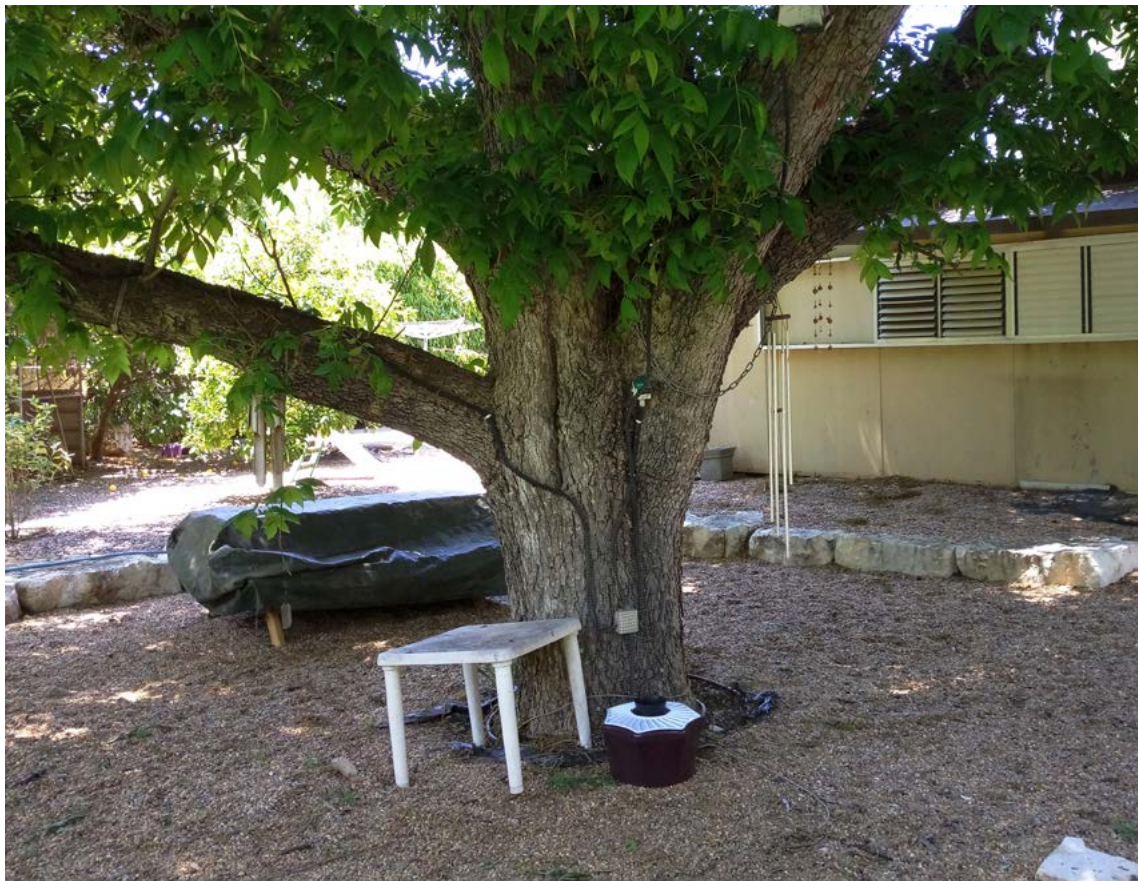
מלכודת (מדגם Mosquiter) ליתושי טיגריס אסייני בוגרים בחצר בית ברמות השבים.

כמו כן, נמצא כי מכלים שחורים המלאים במים מושכים נקבות להטיל בהם יותר מאשר מכלים בהירים. מלכודת הטלה במכל שחור המכילה חלקיקי נחושת יכולה לחסל את הזחלים, אך כאשר איננה מתופעלת נכון, היא עלולה גם להפוך למקור ליתושים.