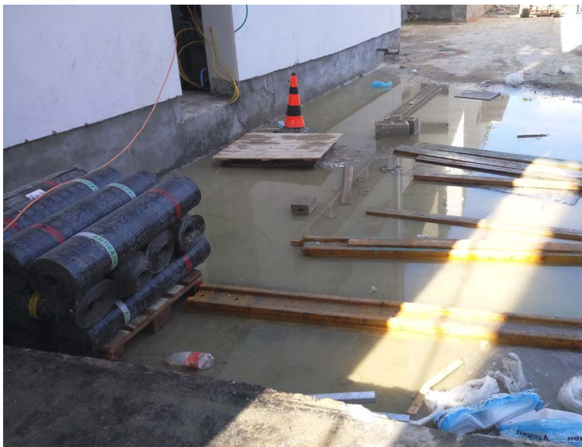
בית גידול ליתושי טגריס אסייני באתר בנייה.

והאוכלוסייה הנקבות רוב הביצים המוטלות יהיו עקרות, ותצמצם בהדרגה. ישנם פתרונות מתקדמים נוספים לצמצום אוכלוסיית היתושים: 1. עיקור יתושים - חשיפת יתושים לקרינה במינונים מסוימים מסוגלת לעקר אותם. נדרש שחרור עקבי של כמות גדולה של יתושים זכרים מעוקרים, שמזדווגים עם הנקבות הפוריות בטבע על חשבון הזכרים הפוריים ומונעים את היווצרות הדורות הבאים. 2. מלכודות מקצועיות - אחת המלכודות היעילות ביותר עבור יתוש הטגריס האסייני היא ה-Lethal ovitrap, הלוכדת ומשמדה נקבות המחפשות מקום הטלה. 3. הנדסה גנטית של יתושים - ניתן לשנות תכונות גנטיות של יתושים במטרה לצמצם את יכולת הנשאות שלהם לנגיפים או במטרה להקטין את האוכלוסייה. 4. הדברה בעזרת פטריות